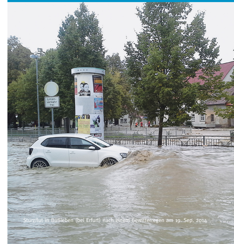
Sturzflut in Büßleben (bei Erfurt) nach einem Gewitterregen am 19. Sep. 2014